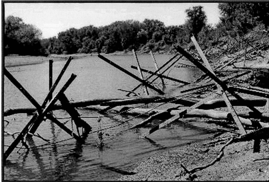
Figura 7. Vista de una serie de Kernell Jacks colocados en Blue River, Kansas, USA. (Fuente: http://www.tostreams.org ).