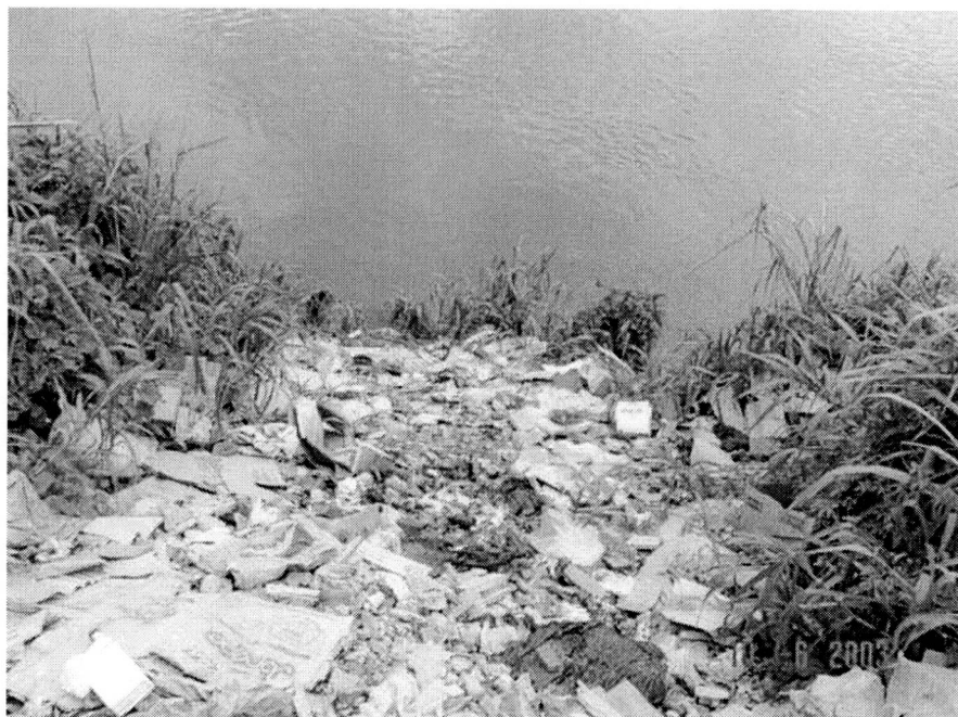
Figura 5. Escombros depositados en el talud.

Las medidas pueden agruparse en preventivas y constructivas.