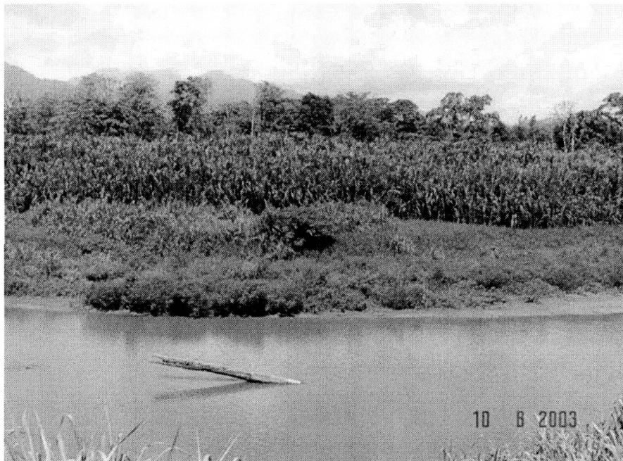
Figura 4. Barra de punta en la margen derecha.

Se observa la colocación de escombros (Figura 5) en el sector donde es visible la mayor acción erosiva. Esto hace que el efecto se acentúe por la restricción al crecimiento de vegetación, favoreciendo la turbulencia local y la remoción de la fracción fina del talud.