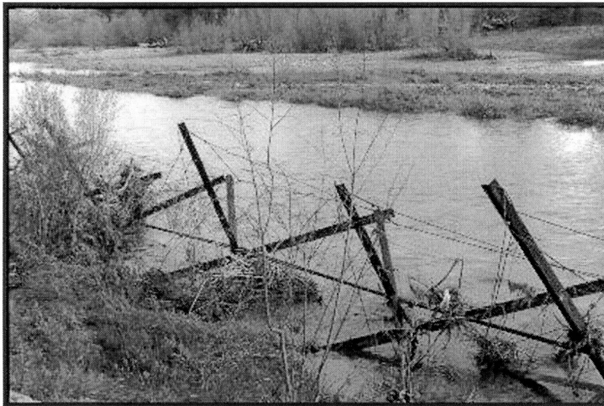
Figura 6. Detalle de una serie de Kernell Jacks colocados en Verde River, Arizona, USA. (Fuente: http://www.tostreams.org ).

En la Figura 8 se observa el efecto final deseado.